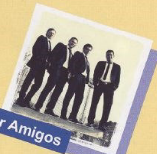
Die Vier Amigos